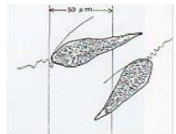
シャットネラ属プランクトン